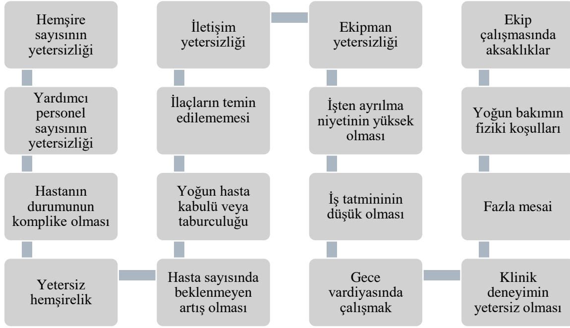
Şekil 2. Bakımın karşılanmama nedenleri